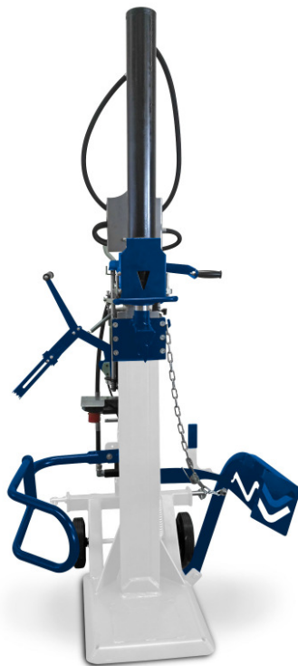
HSE 22-1100 Z